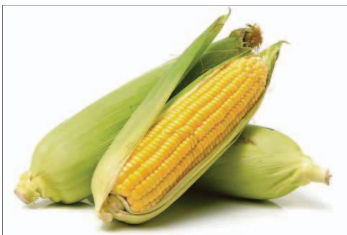
Das Tüargga-Kolpa-Fest findet heute ab 17.30 Uhr im Zentrum von Eschen statt.

Im Zentrum von Eschen werden Kürbisse geschnitten und die heimische Gastronomie und Vereine bieten kulinarische Köstlichkeiten aus Tüargga an. Natürlich darf die Grillwurst auch nicht fehlen und auch Eschner Weine werden angeboten und typisch für den Herbst und die Erntezeit: Sturm oder Suuser, also frischen Weinmost in gärendem Stadium. (pd)